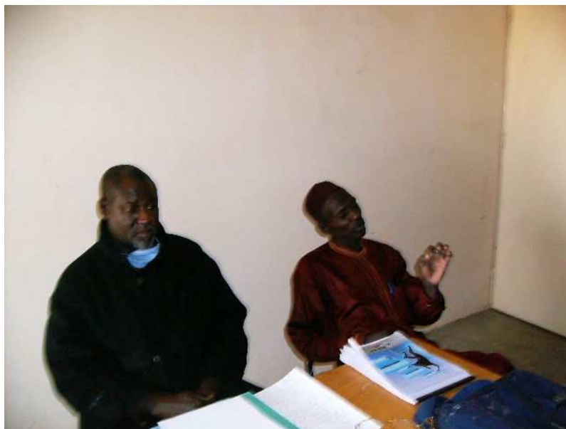
Le maire de Harikanassou lors de la cérémonie d'ouverture

Au niveau de la Commune de Bazaga, le maire a invité les participants à écouter attentivement les exposés des agents de la météorologie sur les thèmes du temps, le climat et les changements climatiques.