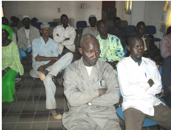
Vue des participants au séminaire de Hamdallaye