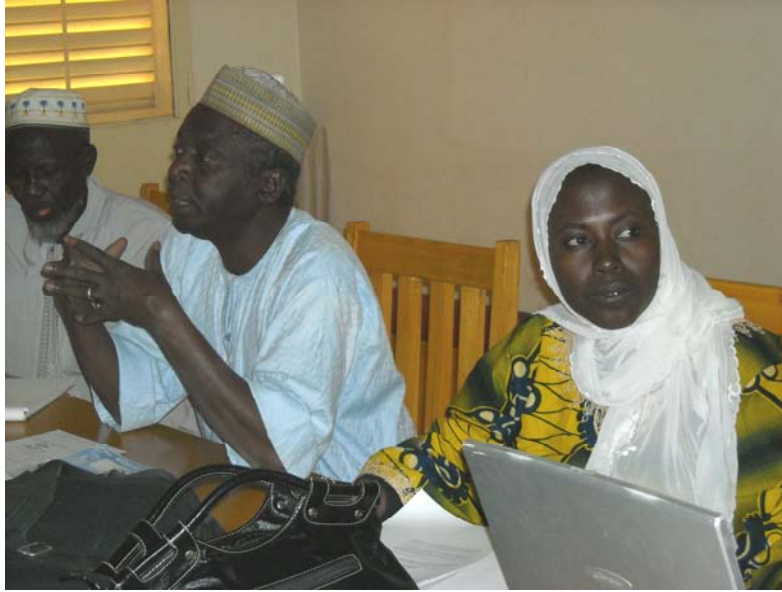
Le maire de Bonkougou entourés des animateurs du séminaire à la cérémonie d'ouverture