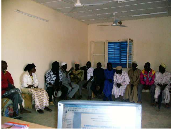
Vue des participants à la formation à Harikanassou