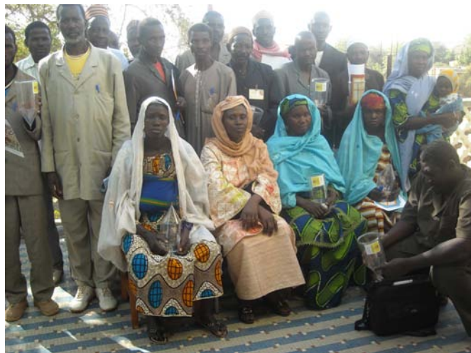
Vue des participants au séminaire de Niamey