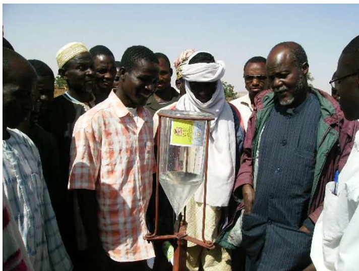
Le chef de la station météorologique de Birni N’Konni lors d’un exercice pratique de lecture du pluviomètre à Bazaga